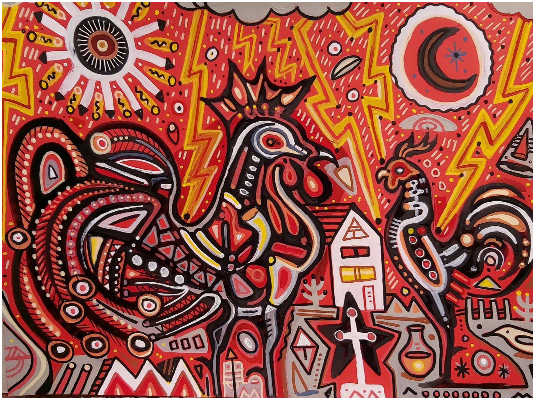
DOIS GALOS NA TEMPESTADE

42 x 29 cm Nanquim e posca sobre papel 2024